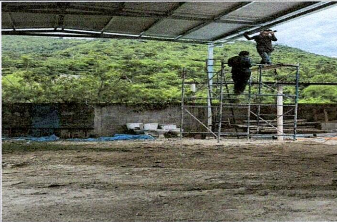
Foto 3: OTRO ÁNGULO DEL ÁREA DONDE LA ESTRUCTURA DE TECHO Y LOSA DE PATIO ESTA MEJORANDO.