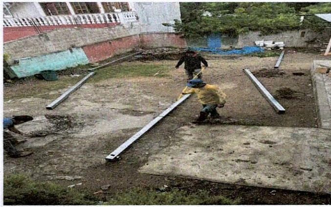
Foto 1: ÁREA DONDE LA ESTRUCTURA DE TECHO Y LOSA DE PATIO ESTA MEJORANDO.