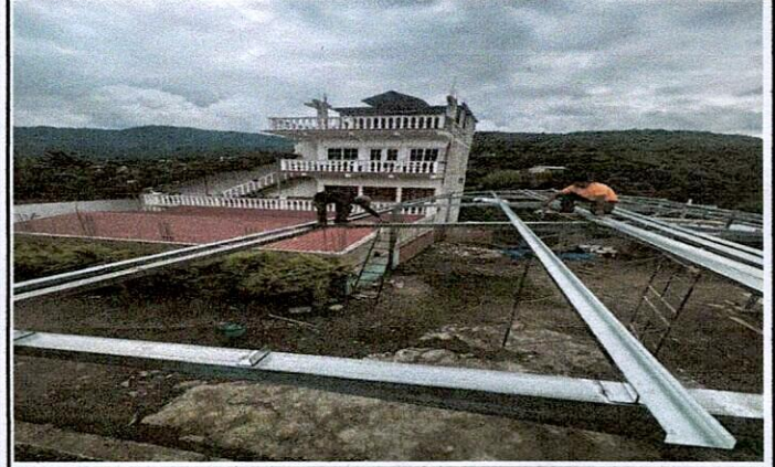
Foto 2: OTRO ÁNGULO DEL ÁREA DONDE LA ESTRUCTURA DE TECHO Y LOSA DE PATIO ESTA MEJORANDO.